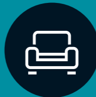
Barangan isi rumah

Pelan pakej yang memberikan anda ketenangan fikiran dengan perlindungan untuk anda, keluarga anda, dan barangan isi rumah anda.