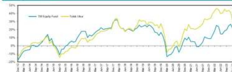
Grafik Kinerja Dana Investasi